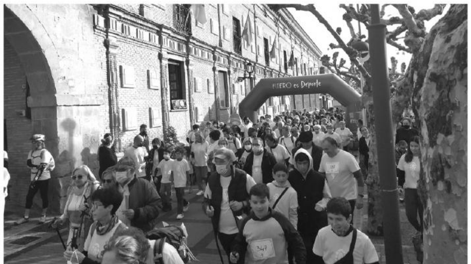
Casi 700 personas se inscribieron en la marcha Circuito de Roscas

El comienzo de la marcha lo marcó con una