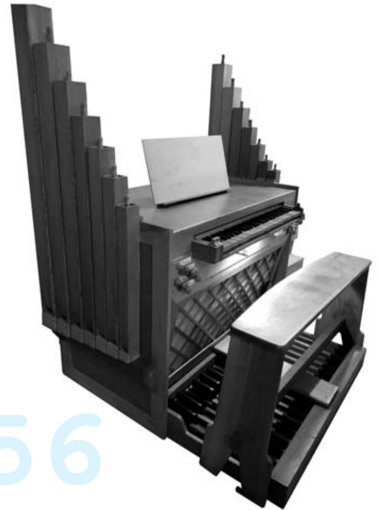
El nuevo órgano positivo del monasterio de Fitero.