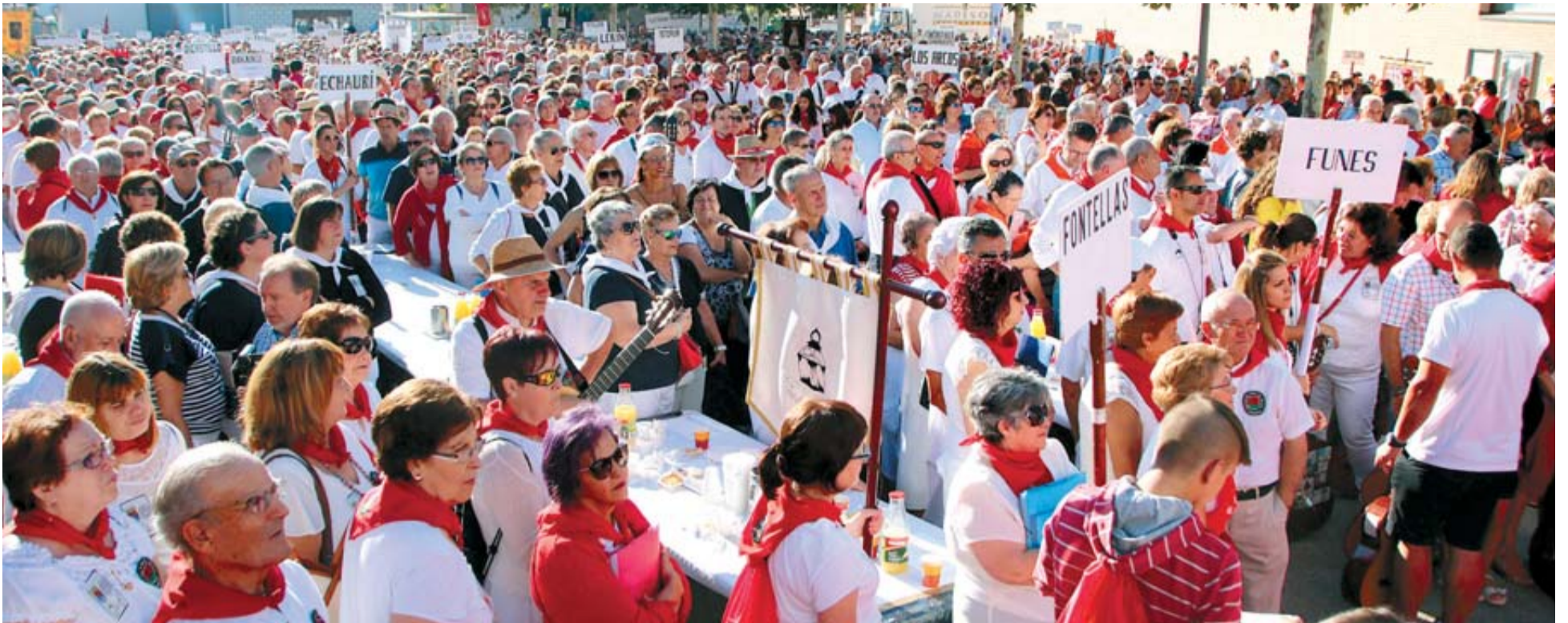
Los grupos de auroros participantes fueron recibidos con un desayuno en la plaza de la Casa de Cultura de Milagro.