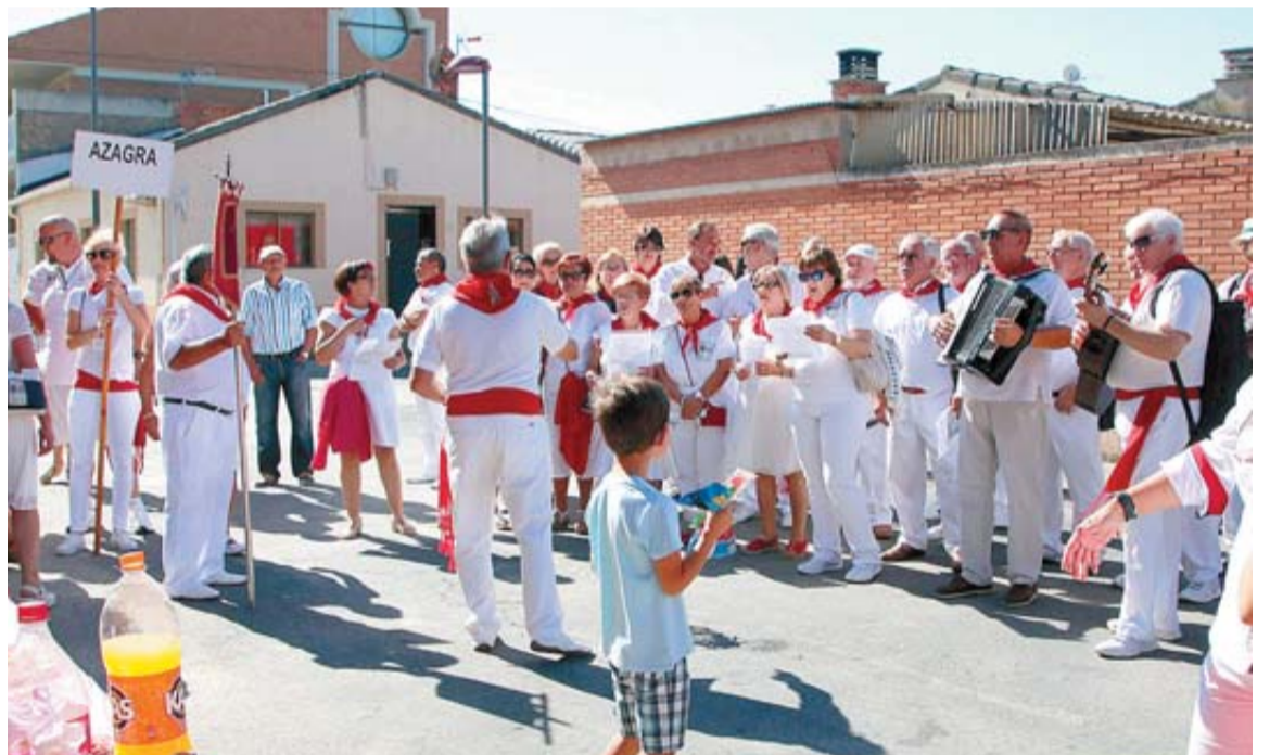
El Grupo de Auroros de Azagra interpreta uno de sus cánticos durante el recorrido trazado.

Concluida la misa, los participantes pudieron disfrutar de una comida de hermandad en el Polideportivo Municipal.