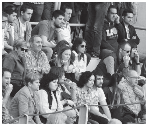
La Plaza de Toros presentó una entrada excepcional para la segunda tarde festiva de San Raimundo