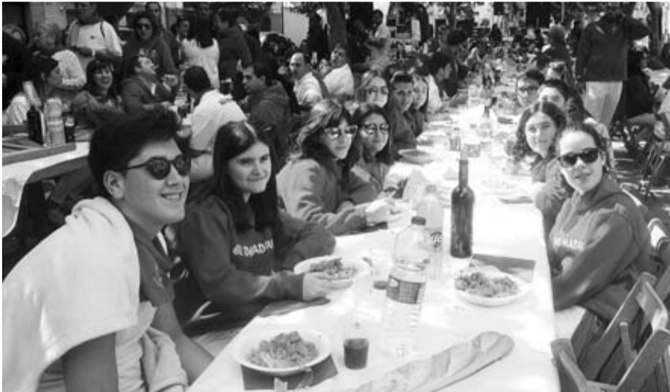
La cuadrilla El Desmadre disfruta de la paellada popular.

Los actos gastronómicos finalizarán mañana, penúltimo día de las fiestas, con un almuerzo popular en la plaza de toros y una pochada popular en la calle Lejalde.