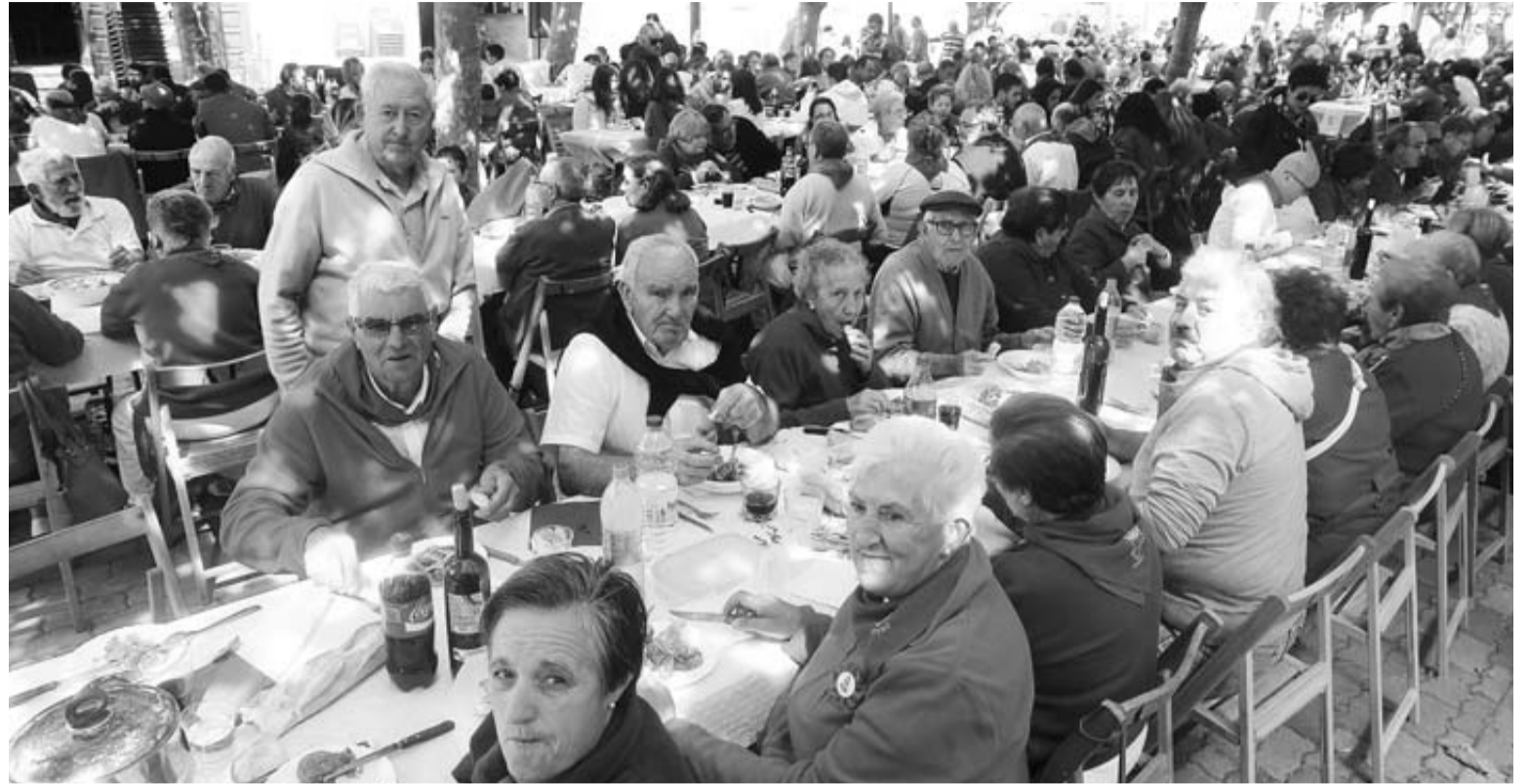
El paseo de San Raimundo, lleno de cuadrillas y familias en el evento gastronómico más popular de las fiestas.

Fue elaborada por la empresa Catering Las Ruedas, de Borja (Aragón), que comenzó a cocinar