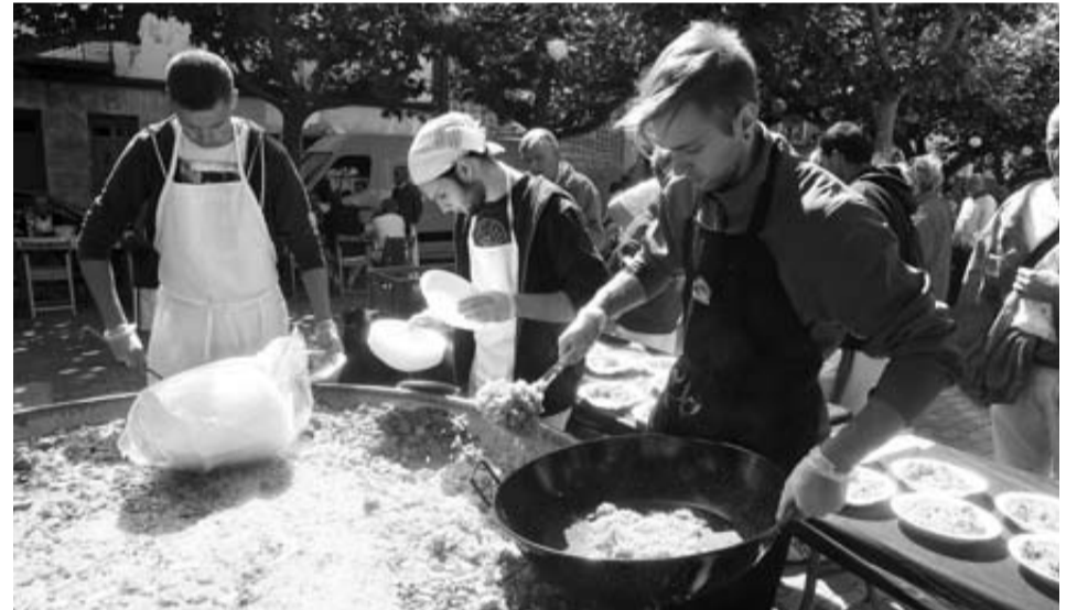
Los cocineros reparten la paella a los asistentes.