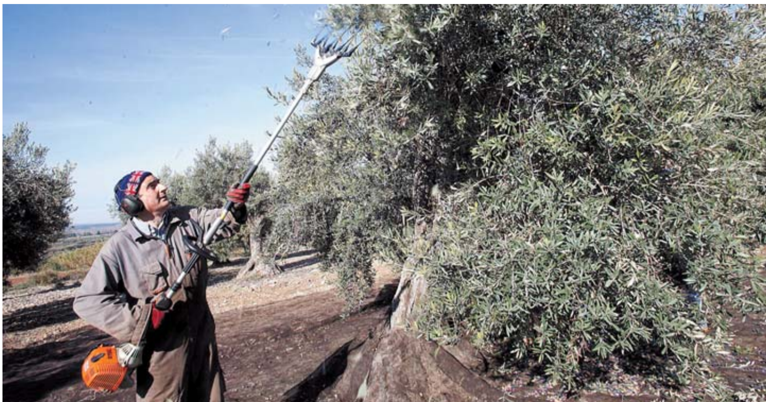
Un olivadero hace caer los frutos de un árbol por medio de una máquina vibradora en un huerto de Barillas.

CONTACTE CON NOSOTROS Teléfono 948 84 84 09 Fax 948 41 08 87 email tudela@diariodenavarra.es