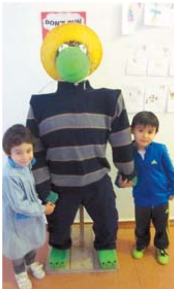
Dos escolares, junto a uno de los 'encantapájaros' y un par de ejemplos más de los trabajos realizados.

natural realizadas por los niños y niñas de cada una de las clases del colegio. Para darles forma han empleado materiales de reciclaje. Estos